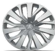
capace 16" RAKYURA