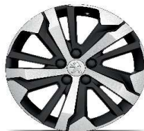
jante aliaj 17" AORAKI