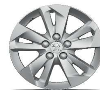
jante aliaj 16" TARANAKI (pt. Grip)