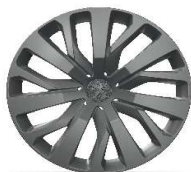
capace 16" TONGARIRO