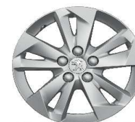
jante aliaj 16" TARANAKI