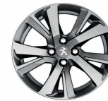
17" Diamanté Eridan Anthra grey